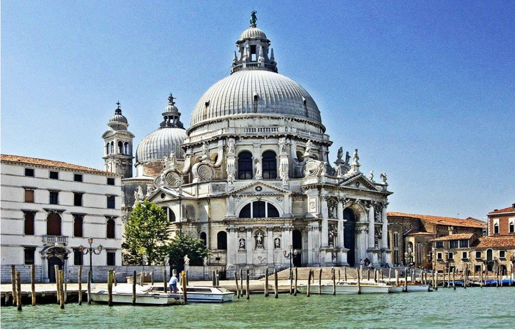
Arquitectura Barroco Italiana.