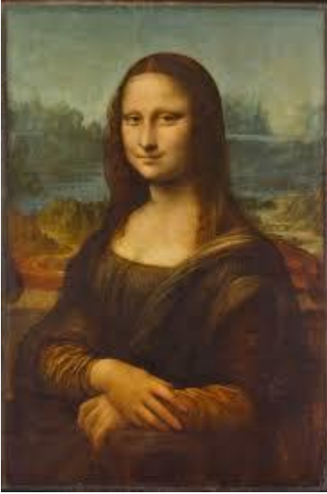
Obra Mona Lisa realizada por Leonardo da Vinci Siglo XVI

Ahora respondamos V o F según corresponda: