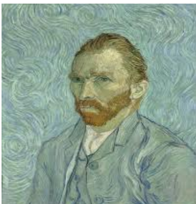
Autorretrato, Artista Vincent Van Gogh 1889.